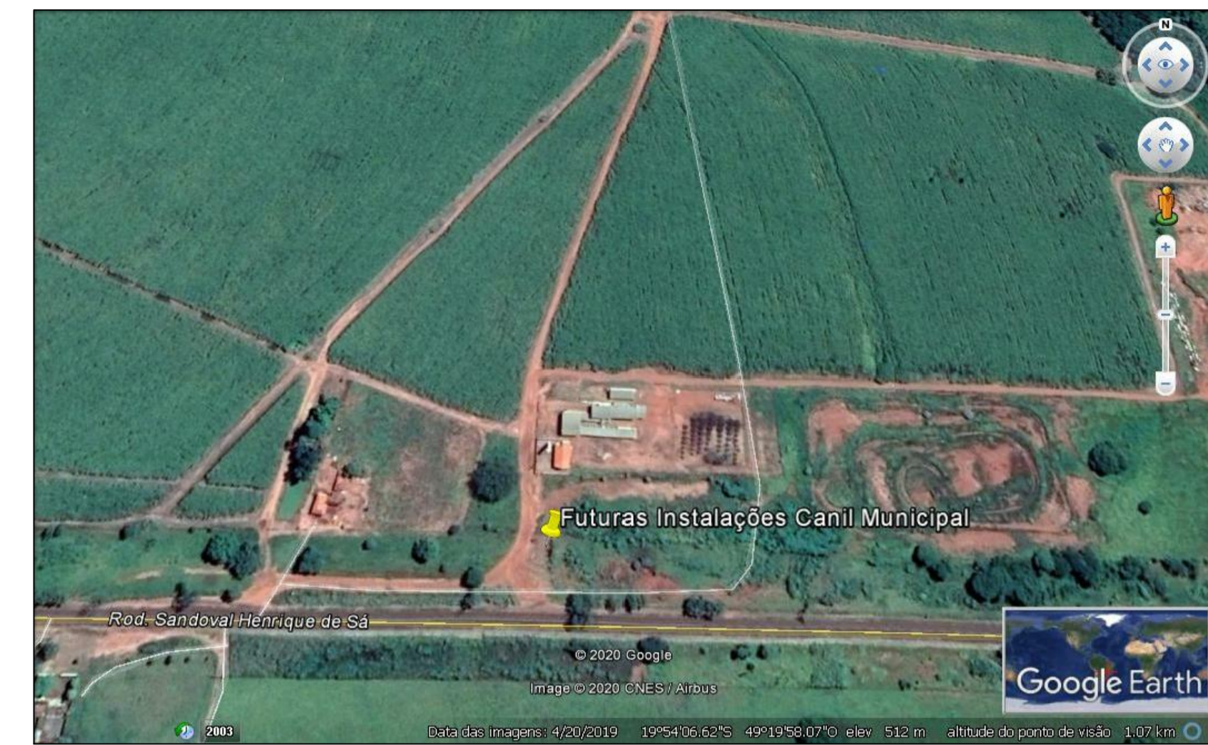
PLANTA DE LOZALIZAÇÃO SEM ESCALA